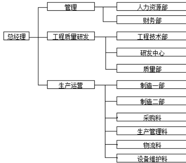
图 3-2 组织机构图