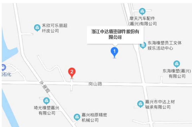
图 3-1 地理位置图